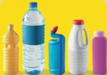
BOUTELLES ET FLACONS EN PLASTIQUE

Merci à tous de votre implication quotidienne pour améliorer le tri !