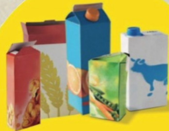
EMBALLAGES EN CARTON ET BRIQUES ALIMENTAIRES